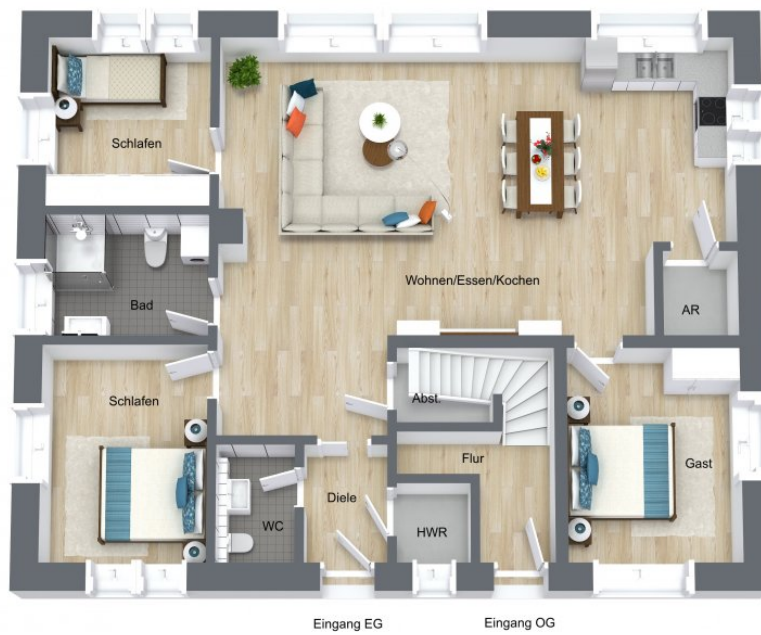
Eingang EG Eingang OG